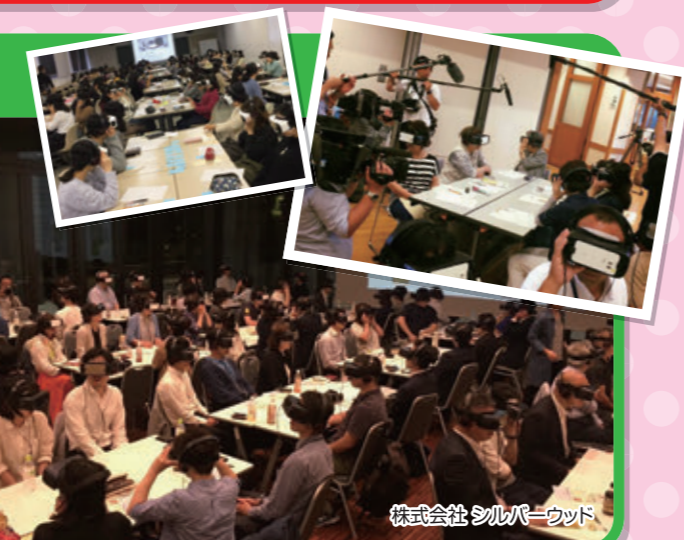
株式会社シルバークラウド